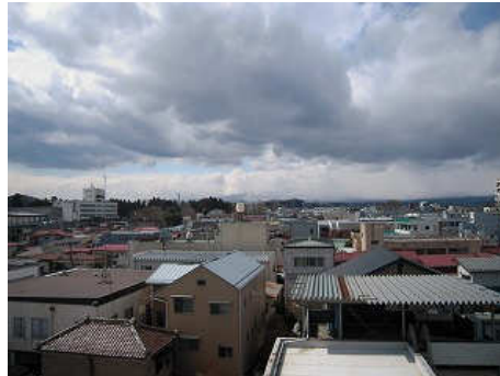
※地震発生より20日後の白河市内。

県南地方における詳しい被害状況は「福島県県南地方振興局」ホームページをご覧ください。 http://www.pref.fukushima.jp/ken-nan/shinko/index/