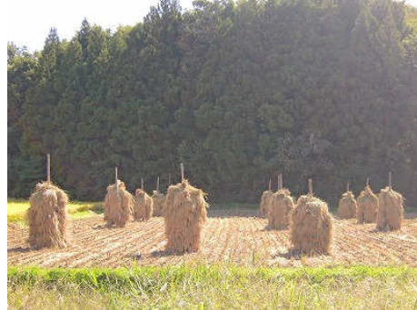
※西郷村での稲刈り風景

福島県では出荷制限の出ている農林水産物を公表しています。検査がおこなわれ、安全なものだけが市場に出荷されています。