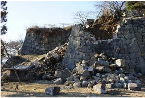
※崩壊した小峰城の石垣

白河市は3月11日の震災で震度6強という激しい揺れに見まわれました。この地震により観光地では白河市の、白河小峰城の石垣が崩壊するなどの被害がありました。現在復旧作業を進めているところです。地震直後はガソリン不足、物流不足にあえいだ県南地方ですが、現在は店舗も復旧し、元の生活に戻りつつあります。震災直後は家屋損壊や道路の陥没等が目立ちましたが、復旧工事が進められています。震災直後の自粛ムードも一掃され、現在は各市町村での復興イベントも盛んです。復興に向けて市町村民が一丸となっています。