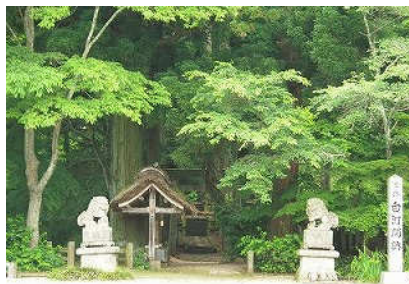
みちのくの玄関口 「白河の関」